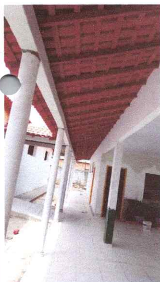
Imagem 05: Reforma da Escola Raimundo Correia.