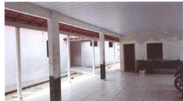
Imagem 07: Reforma da Escola Raimundo Correia.

Simão Pedro Quadros Teixeira Engenheiro Civil - PMV Crea-PA: 1521489947 Prefeitura Municipal de Viseu-PA