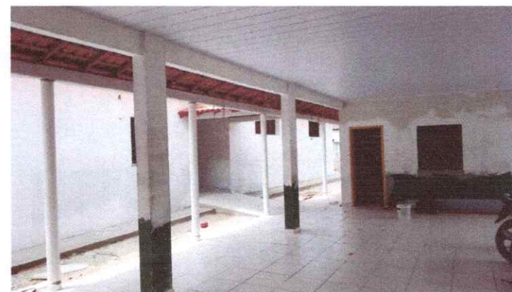
Imagem 07: Reforma da Escola Raimundo Correia.