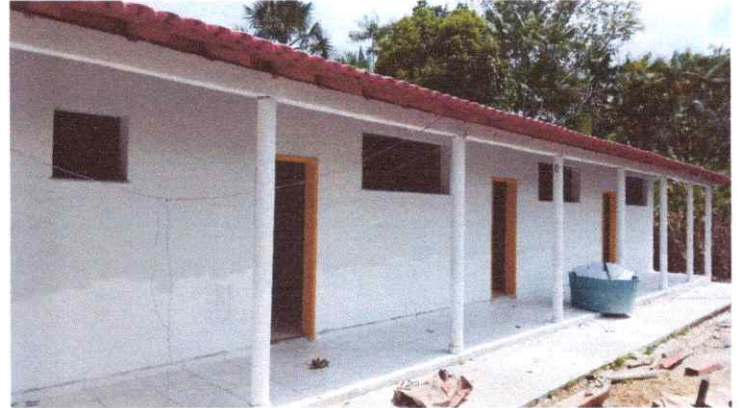
Imagem 02: Reforma da Escola Raimundo Correia.