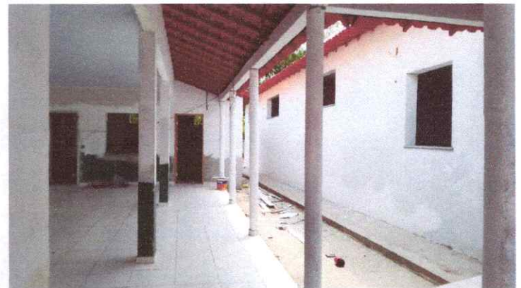
Imagem 04: Reforma da Escola Raimundo Correia.