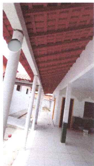
Imagem 05: Reforma da Escola Raimundo Correia.