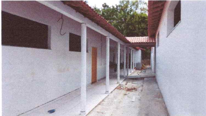
Imagem 01: Reforma da Escola Raimundo Correia.

OBJETO: CONTRATAÇÃO DE EMPRESA ESPECIALIZADA PARA REFORMA E AMPLIAÇÃO DA E.M.E.F. RAIMUNDO SILVA CORREIA - JAPIM, NO MUNICÍPIO DE VISEU/PA.