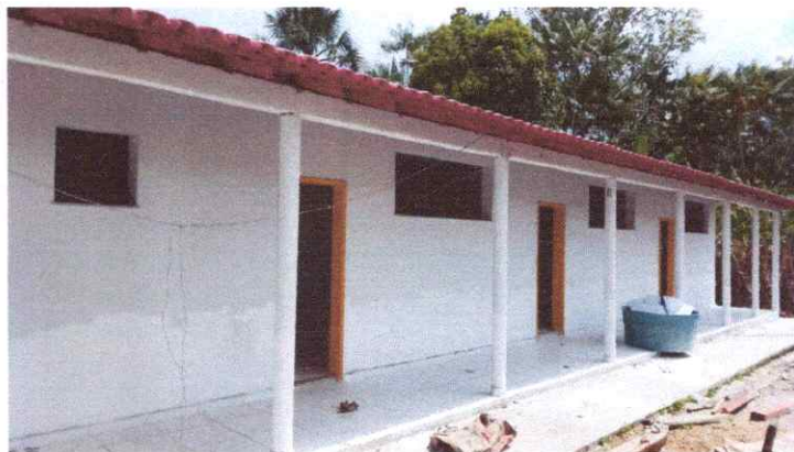
Imagem 02: Reforma da Escola Raimundo Correia.