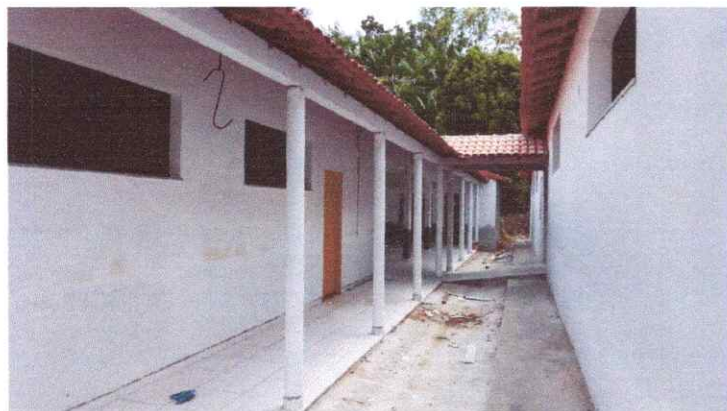
Imagem 01: Reforma da Escola Raimundo Correia.

OBJETO: CONTRATAÇÃO DE EMPRESA ESPECIALIZADA PARA REFORMA E AMPLIAÇÃO DA E.M.E.F. RAIMUNDO SILVA CORREIA - JAPIM, NO MUNICÍPIO DE VISEU/PA.