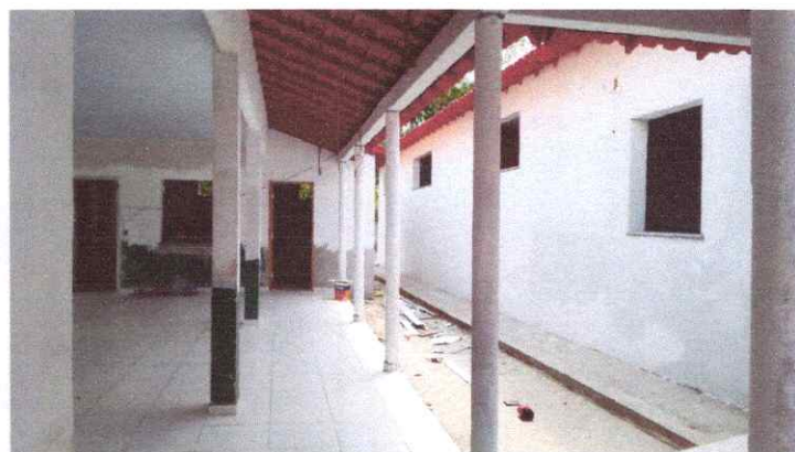
Imagem 04: Reforma da Escola Raimundo Correia.