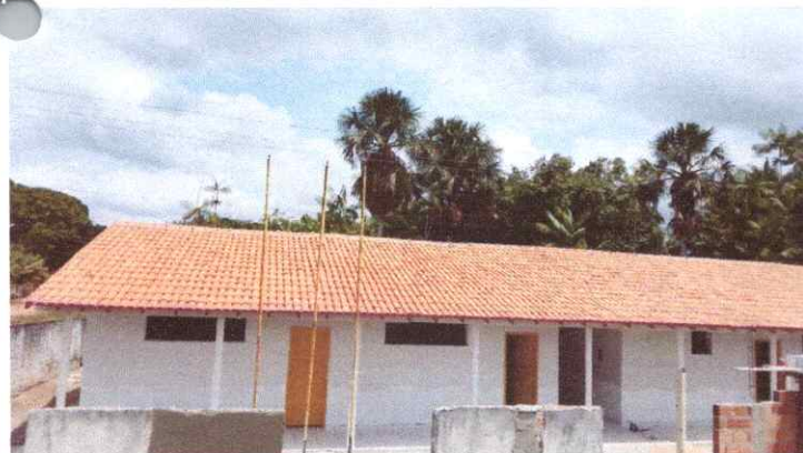
Imagem 03: Reforma da Escola Raimundo Correia.