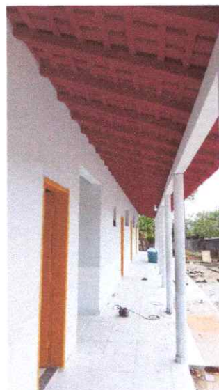
Imagem 06: Reforma da Escola Raimundo Correia.