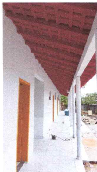
Imagem 06: Reforma da Escola Raimundo Correia.