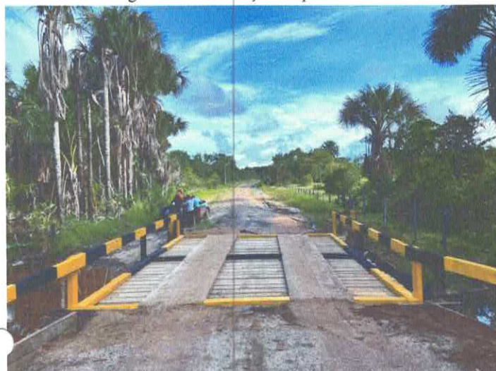
Imagem 03: Construção de ponte.