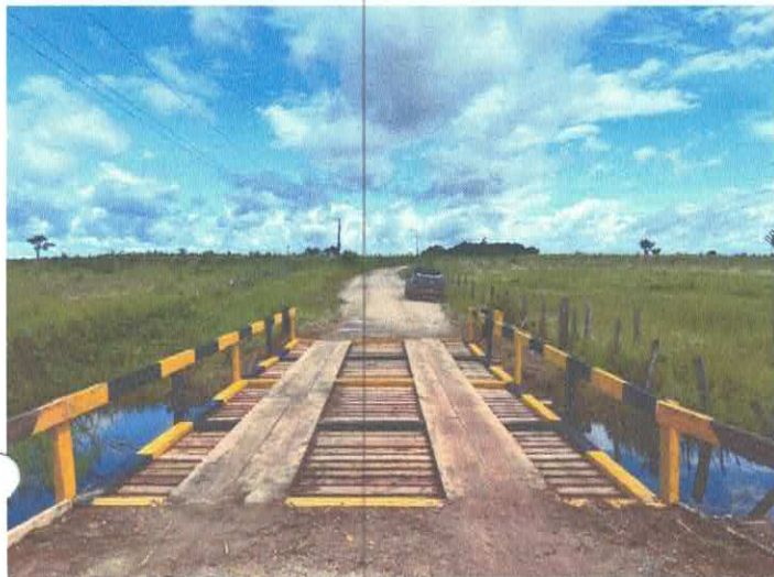
Imagem 01: Construção de ponte.

OBJETO: CONTRATAÇÃO DE EMPRESA ESPECIALIZADA EM CONSTRUÇÃO E REFORMA DE PONTES DE MADEIRA, NO MUNICÍPIO DE VISEU/PA