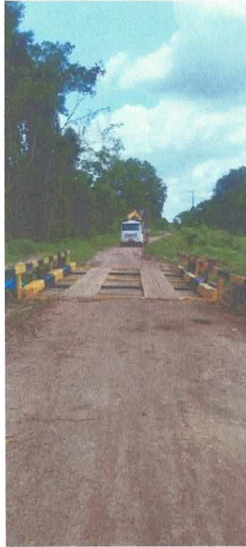
Imagem 08: Construção de ponte.