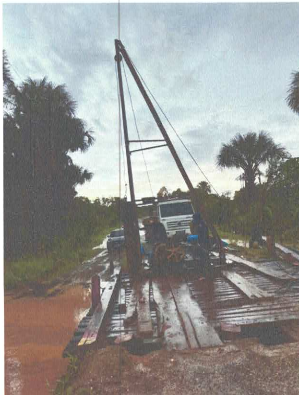
Imagem 10: Construção de ponte.