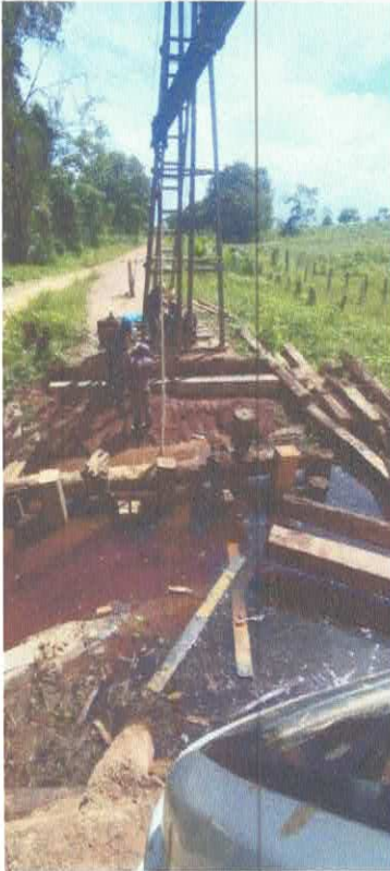
Imagem 07: Construção de ponte.

OBJETO: CONTRATAÇÃO DE EMPRESA ESPECIALIZADA EM CONSTRUÇÃO E REFORMA DE PONTES DE MADEIRA, NO MUNICÍPIO DE VISEU/PA