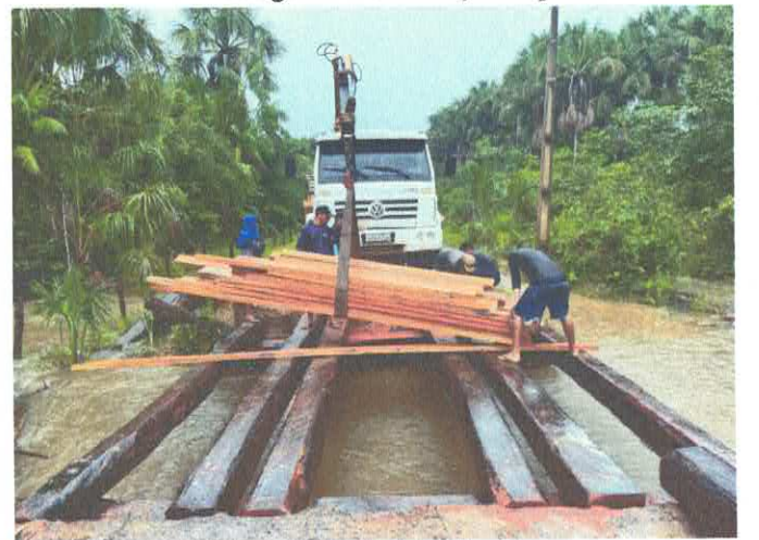
Imagem 06: Construção de ponte.