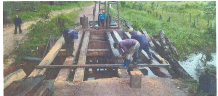
Imagem 11: Construção de ponte.

CARLOS AUGUSTO PINTO CORREA:00 433788208 Assinado de forma digital por CARLOS AUGUSTO PINTO CORREA:0043378 8208 Dados: 2026.01.05 17:12:44 -03'00'