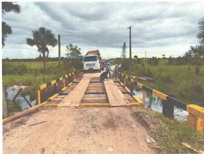
Imagem 04: Construção de ponte.