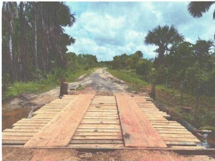
Imagem 02: Construção de ponte.