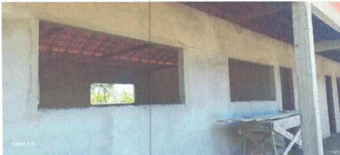
Imagem 03: Construção da E.M.E.F. Ângela Reis