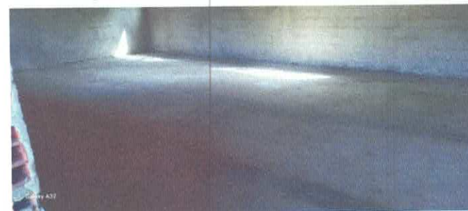
Imagem 10: Construção da E.M.E.F. Ângela Reis