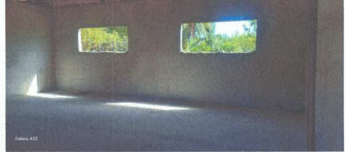
Imagem 02: Construção da E.M.E.F. Ângela Reis