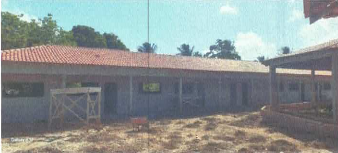
Imagem 01: Construção da E.M.E.F. Ângela Reis

OBJETO: CONTRATAÇÃO DE EMPRESA ESPECIALIZADA PARA FINALIZAÇÃO DA CONSTRUÇÃO DA E.M.E.F. PROFESSORA ANGELA OLIVEIRA REIS, POLO DE LIMONDEUA - LOCALIDADE DE TAPEREBATEUA, NO MUNICÍPIO DE VISEU/PA.