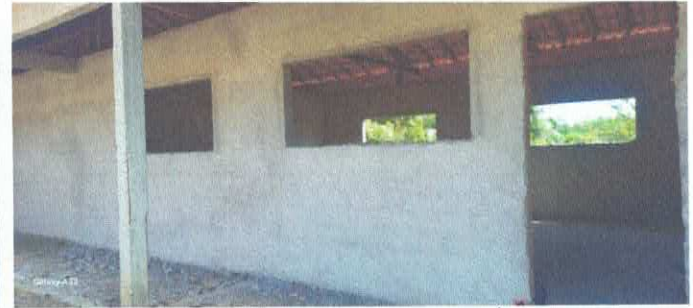
Imagem 04: Construção da E.M.E.F. Ângela Reis