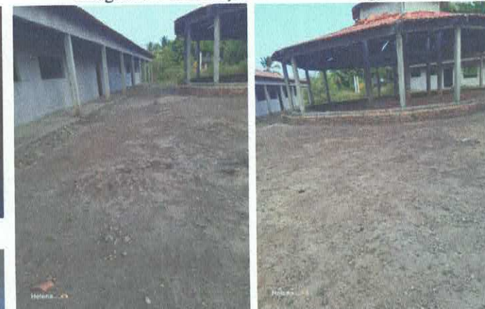
Imagens 08 e 09: Construção da E.M.E.F. Ângela Reis