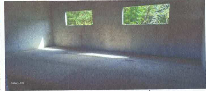
Imagem 06: Construção da E.M.E.F. Ângela Reis