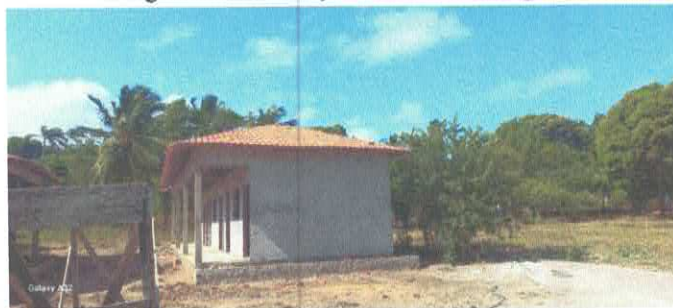
Imagem 05: Construção da E.M.E.F. Ângela Reis