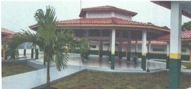
Imagem 03: Escola do Itambá.