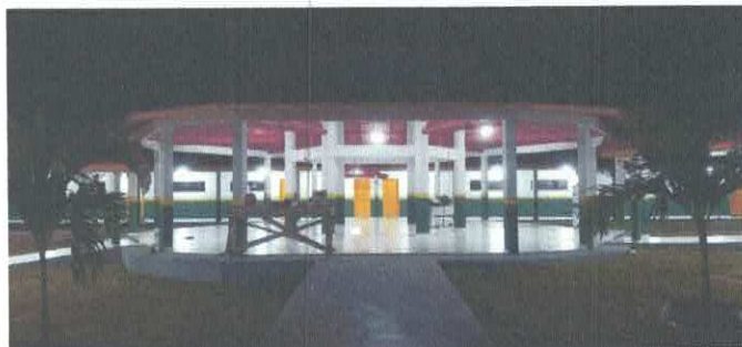
Imagem 05: Escola do Itambá.

CARLOS AUGUSTO PINTO Assinado de forma digital por CARLOS AUGUSTO PINTO CORREA: 0043378 8208 CORREA:00433 788208 Dados: 2026.03.30 09:30:50 -03'00'