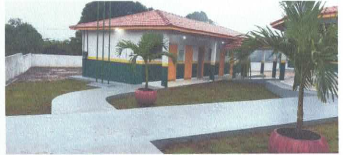
Imagem 04: Escola do Itambá.