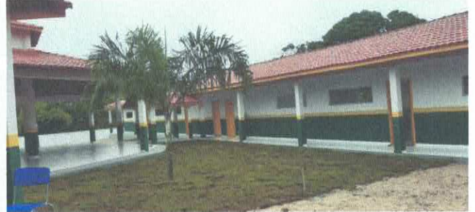
Imagem 02: Escola do Itambá