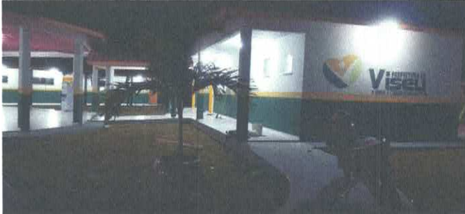
Imagem 01: Escola do Itambá.

OBJETO: CONTRATAÇÃO DE EMPRESA ESPECIALIZADA PARA FINALIZAÇÃO DA CONSTRUÇÃO DA E.M.E.F. MANOEL FURTADO – POLO CURUPAITI – LOCALIDADE DE ITAMBÁ, NO MUNICÍPIO DE VISEU/PA.