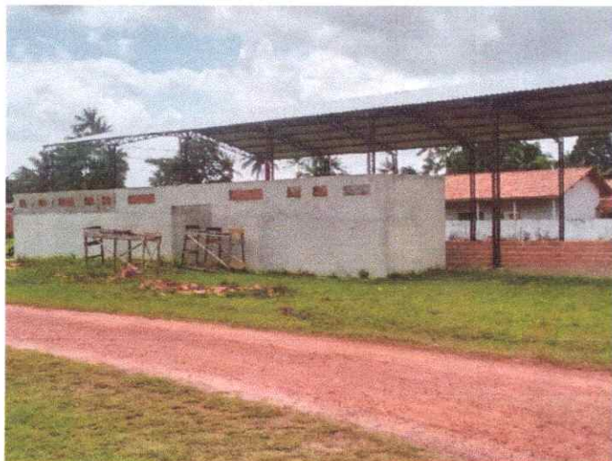
Imagem 01: Construção de quadra poliesportiva.

OBJETO: CONSTRUÇÃO DE 01 (UMA) QUADRA POLIESPORTIVA COM VESTIÁRIO E ARQUIBANCADAS COBERTAS, COM ÁREA CONSTRUÍDA DE 885 m 2 – NA LOCALIDADE DE BRAÇO VERDE, NO MUNICÍPIO DE VISEU-PA.