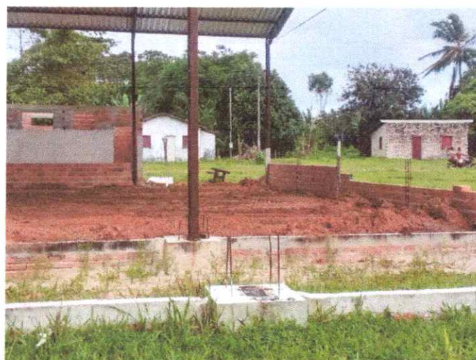
Imagem 04: Construção de quadra poliesportiva.