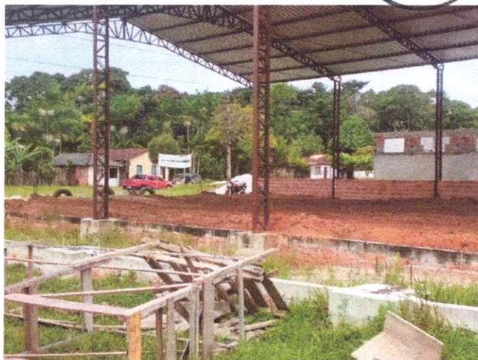
Imagem 02: Construção de quadra poliesportiva.