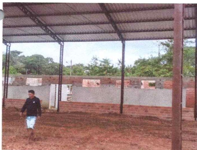
Imagem 05: Construção de quadra poliesportiva.

CARLOS AUGUSTO PINTO CORREA:004337 88208