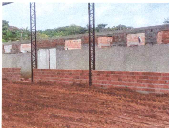
Imagem 03: Construção de quadra poliesportiva.