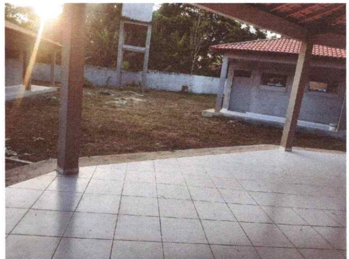
Imagem 06: Construção da Escola Manoel Furtado.