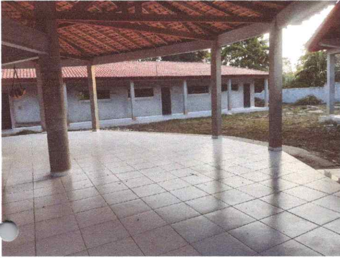
Imagem 01: Construção da Escola Manoel Furtado.

OBJETO: CONTRATAÇÃO DE EMPRESA ESPECIALIZADA PARA FINALIZAÇÃO DA CONSTRUÇÃO DA E.M.E.F. MANOEL FURTADO - POLO CURUPAITI - LOCALIDADE DE ITAMBÁ, PADRÃO FNDE, NO MUNICÍPIO DE VISEU/PA.