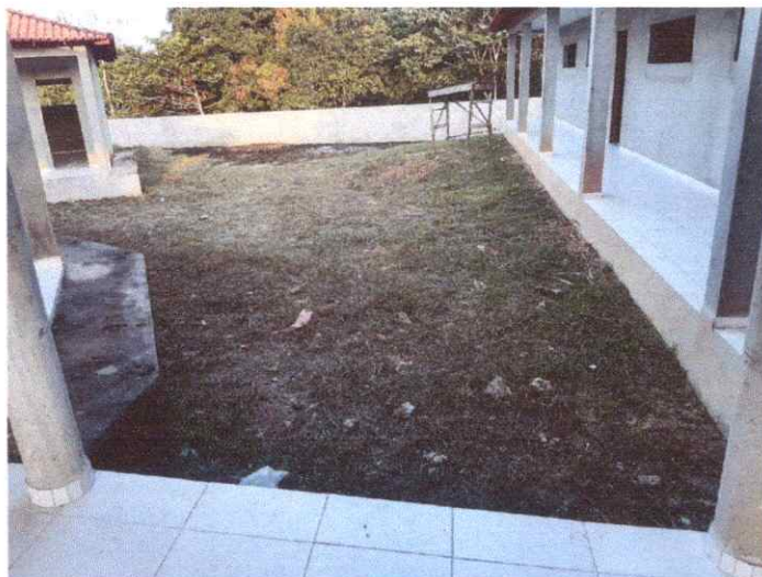
Imagem 05: Construção da Escola Manoel Furtado.