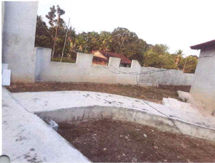
Imagem 03: Construção da Escola Manoel Furtado.