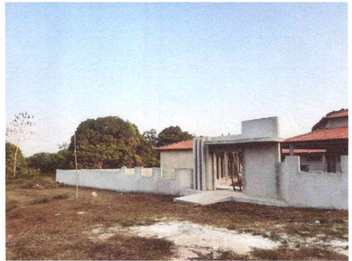
Imagem 04: Construção da Escola Manoel Furtado.