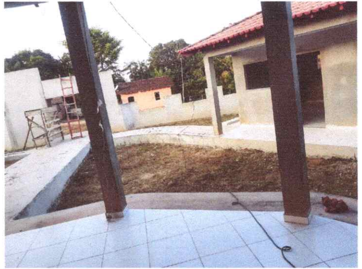
Imagem 02: Construção da Escola Manoel Furtado.