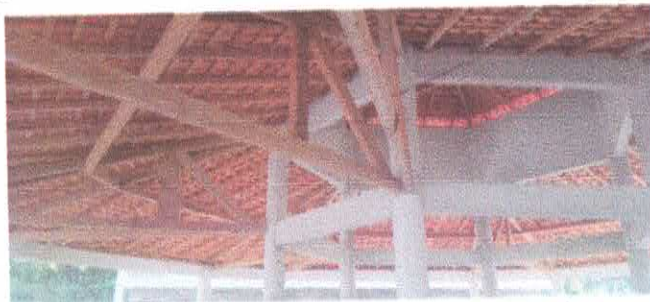
Imagem 02: Reforma da Escola Lucelina de Fátima.