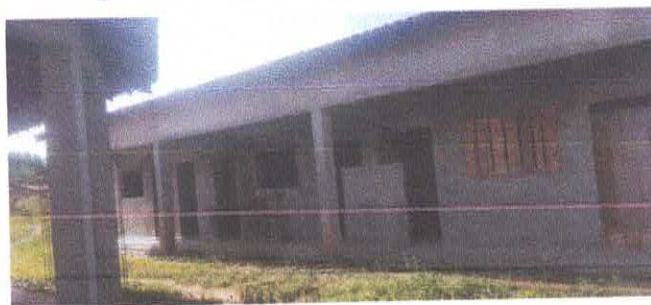
Imagem 04: Reforma da Escola Lucelina de Fátima.