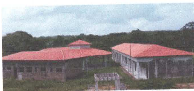
Imagem 05: Reforma da Escola Lucelina de Fátima..