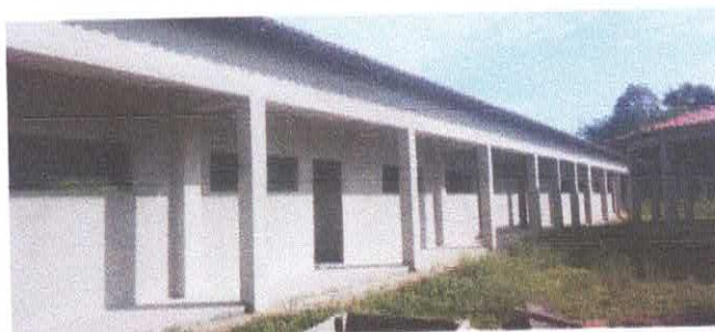
Imagem 06: Reforma da Escola Lucelina de Fátima.