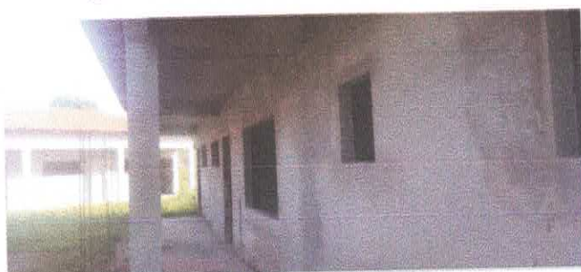
Imagem 07: Reforma da Escola Lucelina de Fátima..

CARLOS AUGUSTO PINTO CORREA:00 433788208