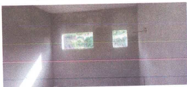
Imagem 03: Reforma da Escola Lucelina de Fátima.