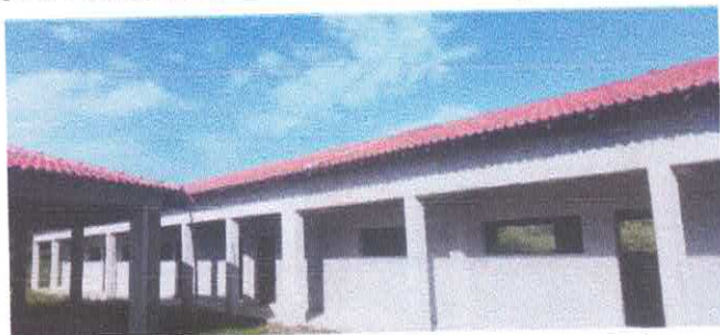
Imagem 01: Reforma da Escola Lucelina de Fátima.

OBJETO: CONTRATAÇÃO DE EMPRESA ESPECIALIZADA PARA A FINALIZAÇÃO DA CONSTRUÇÃO DA E.M.E.F. LUCELINA DE FÁTIMA SANTOS CARVALHO - POLO AÇAITEUA - LOCALIDADE DE CENTRO ALEGRE - PADRÃO FNDE, NO MUNICÍPIO DE VISEU-PA.