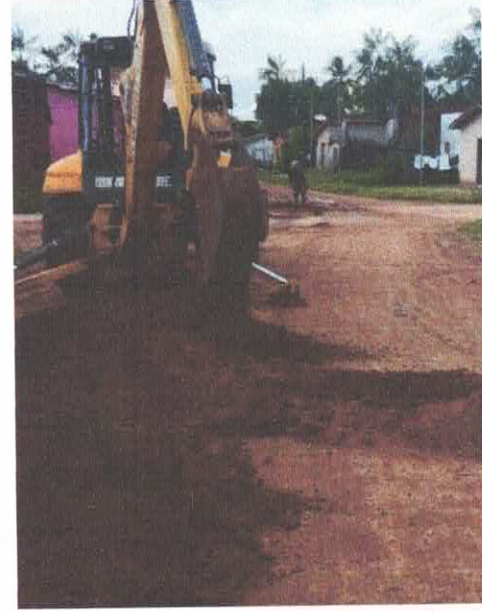
Imagem 03: Construção do sistema de abastecimento de água.