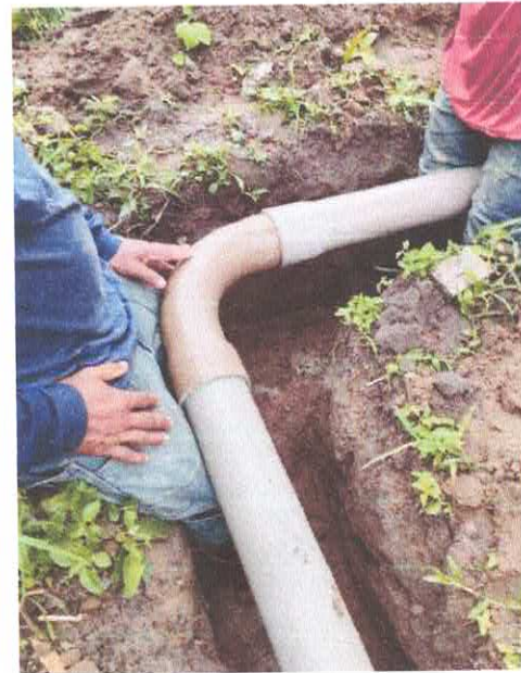
Imagem 06: Construção do sistema de abastecimento de água.

CARLOS AUGUSTO PINTO CORREA:00433788 208 Assinado de forma digital por CARLOS AUGUSTO PINTO CORREA:00433788208