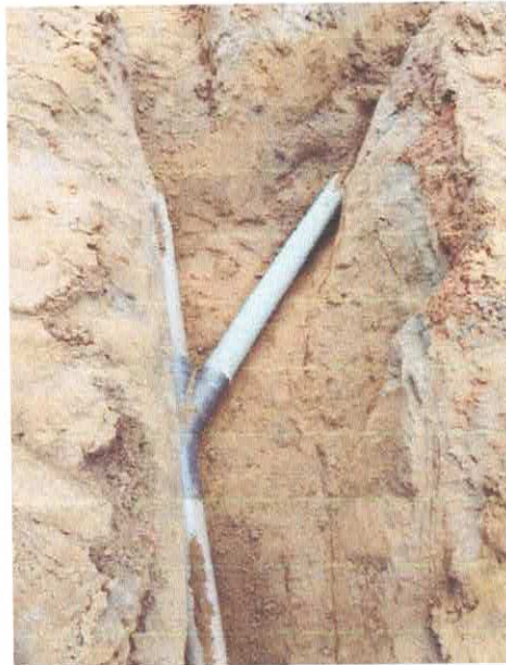
Imagem 05: Construção do sistema de abastecimento de água.