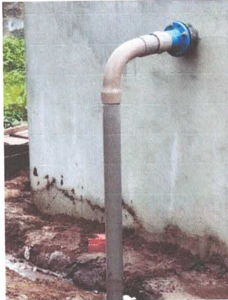
Imagem 02: Construção do sistema de abastecimento de água.