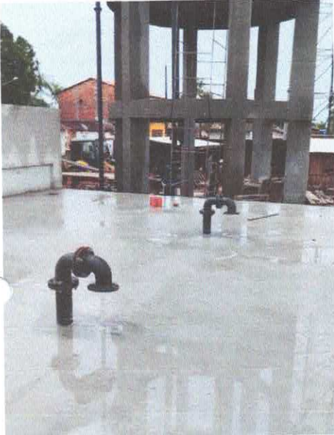
Imagem 01: Construção do sistema de abastecimento de água.

OBJETO: Contratação de empresa especializada para construção do Sistema de Abastecimento de Água da localidade de Fernandes Belo no município de Viseu-PA.