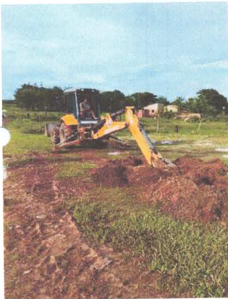
Imagem 04: Construção do sistema de abastecimento de água.