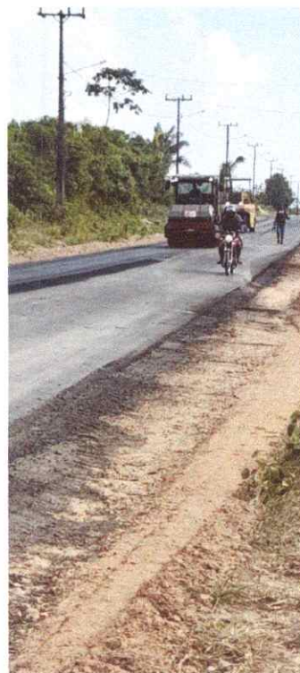
Imagem 04: Alfalto Laguiño.