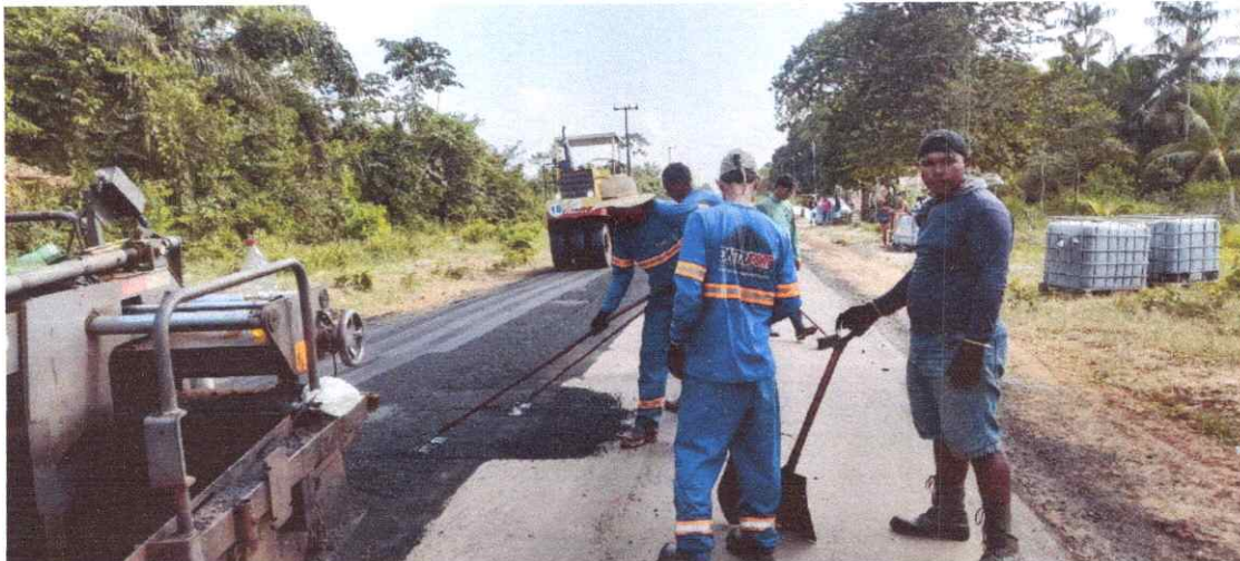
Imagem 01: Alfalto Laguiño.

CONTRATO: Nº 613/2022/CPL TOMADA DE PREÇO: Nº 029/2022. CONVÊNIO: SEDOP Nº 285/2022 OBJETO: Contratação de empresa especializada para o serviço de pavimentação asfáltica de 1,9 km na comunidade de Laguiño, no município de Viseu/PA.