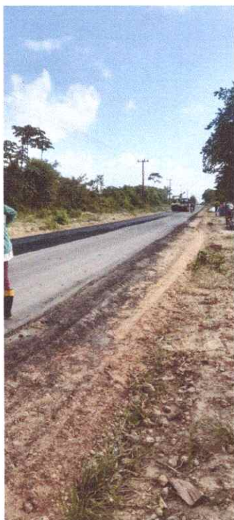
Imagem 02: Alfalto Laguiño.