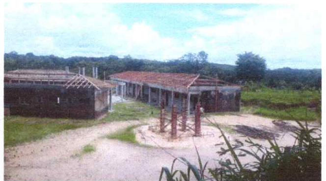
Imagem 04: Visão panorâmica.