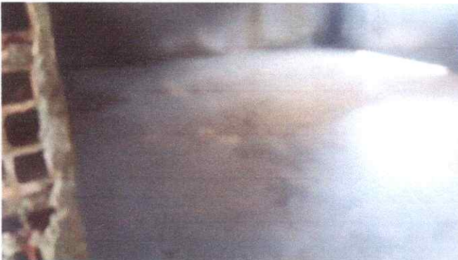
Imagem 03: Contrapiso .