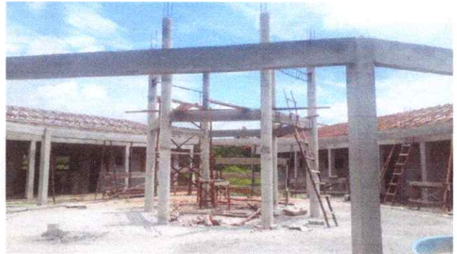
Imagem 02: Elevação estrutural.