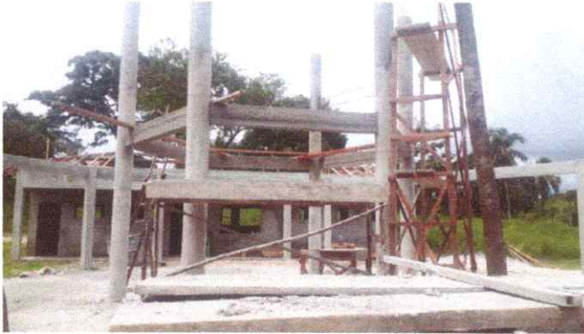
Imagem 01: Elevação estrutural.

FINALIZAÇÃO DA E.M.E.F. LUCELINA DE FÁTIMA SANTOS - POLO AÇAITEUA – LOCALIDADE DE CENTRO ALEGRE NO MUNICÍPIO DE VISEU-PA.