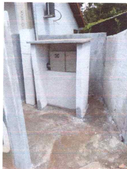
Imagem 03: Implantação em Faveiro.