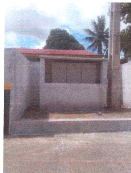
Imagem 06: Implantação em Maratauna.

CARLOS AUGUSTO PINTO CORREA:0043 3788208