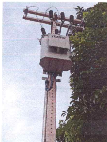
Imagem 05: Implantação em Limondeua.