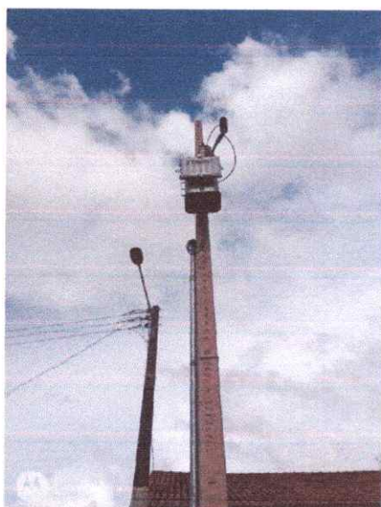
Imagem 04: Implantação em Biteua.