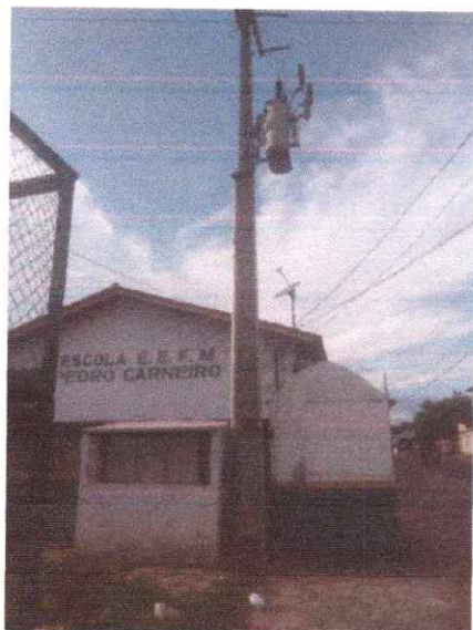
Imagem 01: Implantação em Pedro Carneiro.

OBJETO: CONTRATAÇÃO DE EMPRESA ESPECIALIZADA NA IMPLANTAÇÃO DE SUBESTAÇÃO, PARA AS ESCOLAS MUNICIPAIS DE VISEU/PA, EM ATENDIMENTO À SECRETARIA MUNICIPAL DE EDUCAÇÃO.