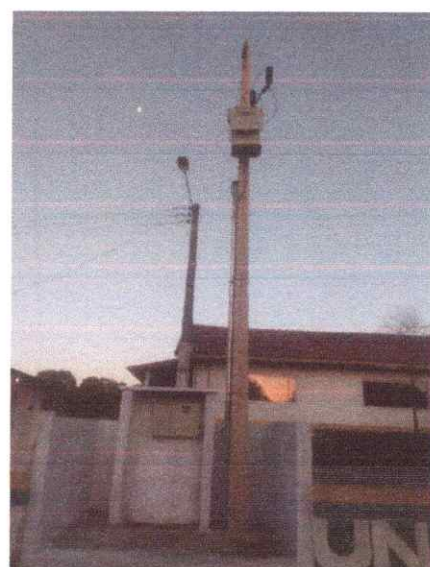
Imagem 03: Implantação em Biteua.