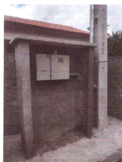
Imagem 06: Implantação em Carrapatinho.

CARLOS AUGUSTO PINTO CORREA:004337 88208