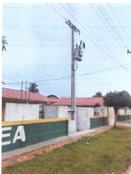
Imagem 02: Implantação em Açaitéua.