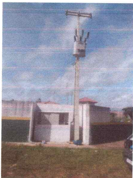
Imagem 04: Implantação em Fernandes Belo.