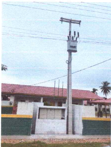
Imagem 01: Implantação em Açaitéua.

OBJETO: CONTRATAÇÃO DE EMPRESA ESPECIALIZADA NA IMPLANTAÇÃO DE SUBESTAÇÃO, PARA AS ESCOLAS MUNICIPAIS DE VISEU/PA, EM ATENDIMENTO À SECRETARIA MUNICIPAL DE EDUCAÇÃO.