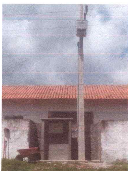
Imagem 05: Implantação em Carrapatinho.