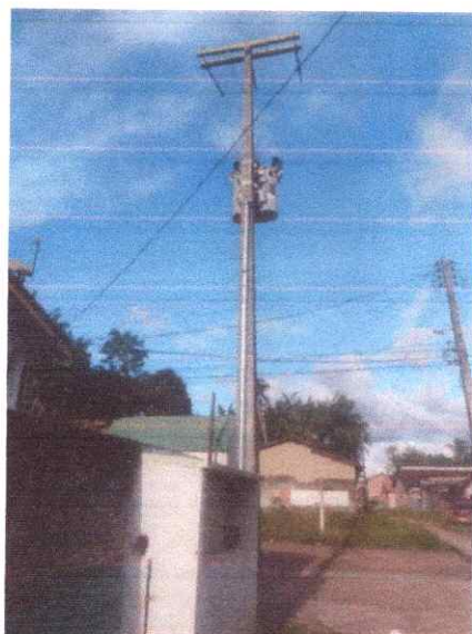
Imagem 02: Implantação em Pedro Carneiro.