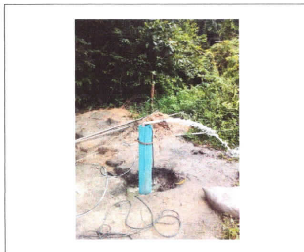
PERFURAÇÃO DE POÇO