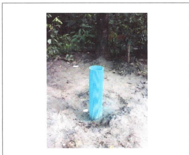
PERFURAÇÃO DE POÇO