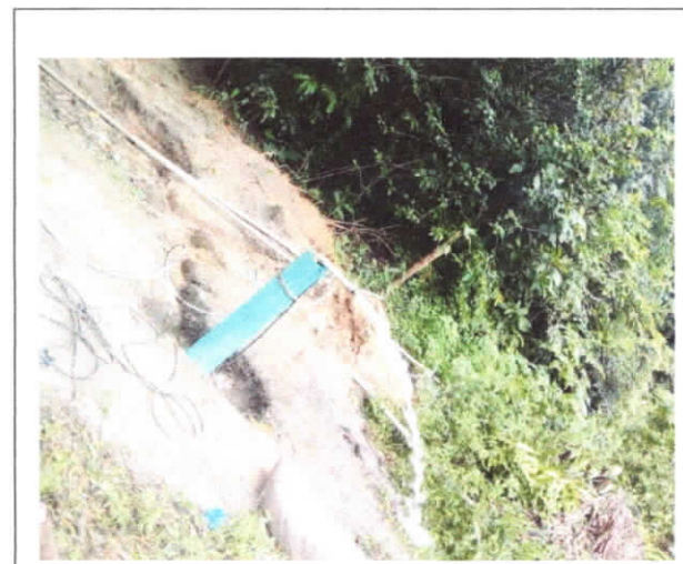
PERFURAÇÃO DE POÇO