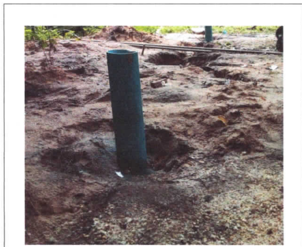
PERFURAÇÃO DE POÇO