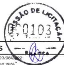
TABELA DE ENCARGOS SOCIAIS