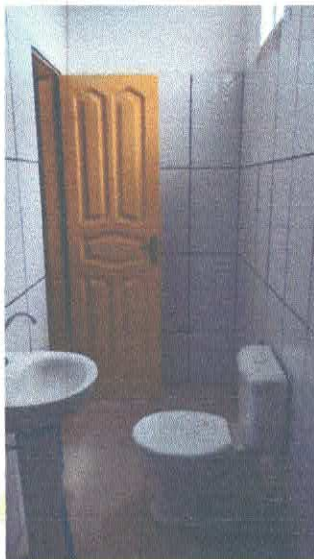
Imagem 09: Banheiro