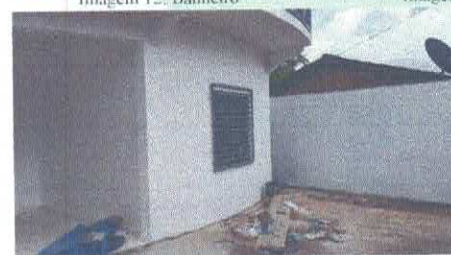
Imagem 15: Janela com grade