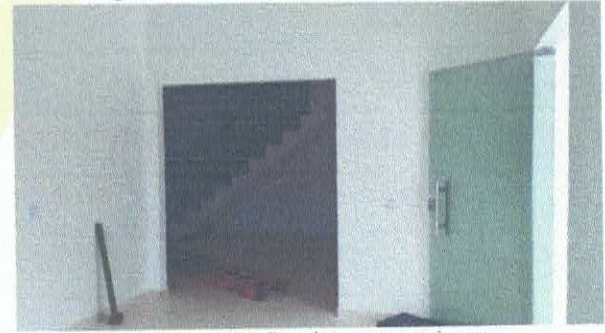
Imagem 06: Parede com revestimento