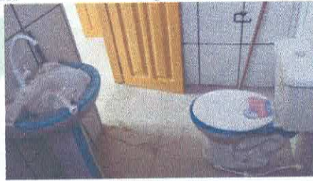
Imagem 16: Banheiro