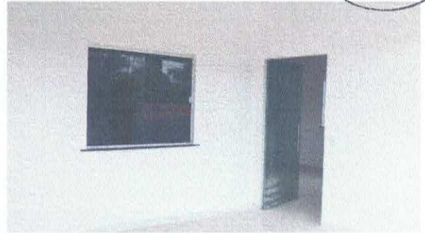
Imagem 02: Esquadria de vidro