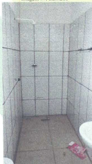
Imagem 12: Banheiro