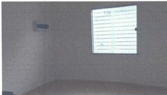
Imagem 03: Janela com grade