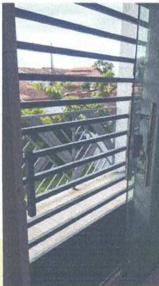
Imagem 10: Grade