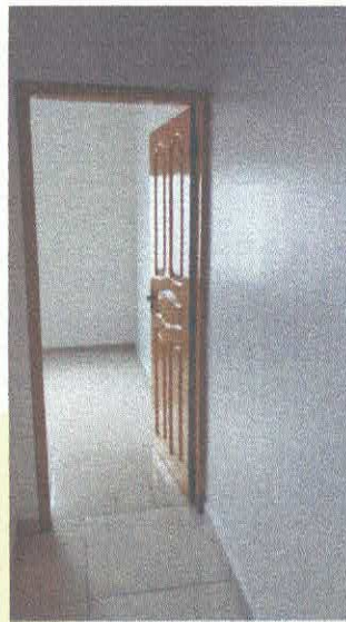
Imagem 11: Porta de madeira