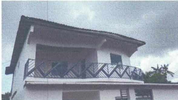
Imagem 01: Fachada