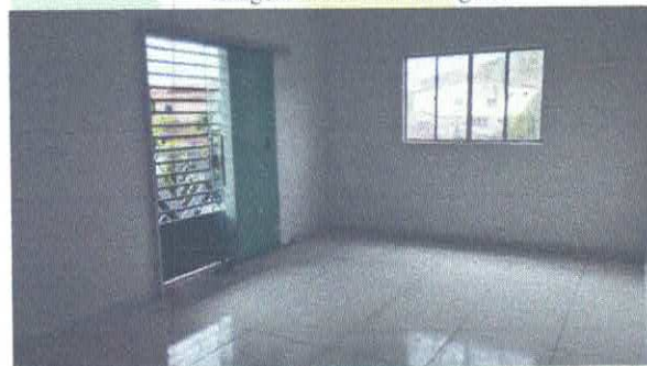
Imagem 05: Porta com grade