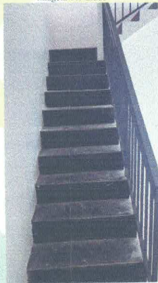
Imagem 13: Escada