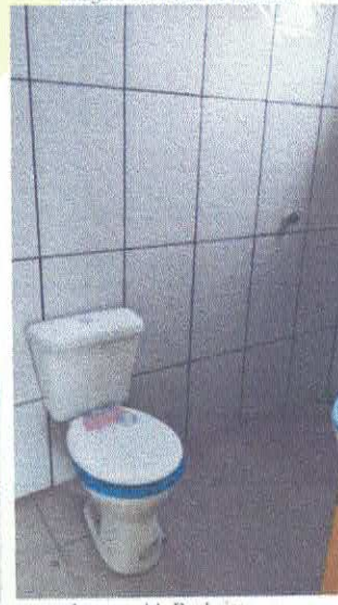
Imagem 14: Banheiro