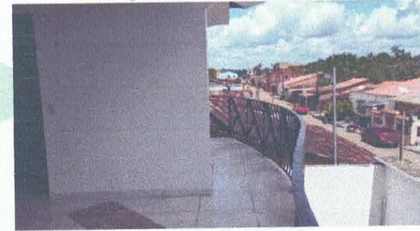
Imagem 08: Guarda-corpo