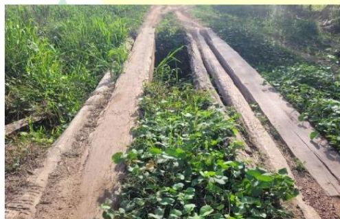
FOTO 16- construção da Ponte da Estrada da Vila Verde Ponte 1