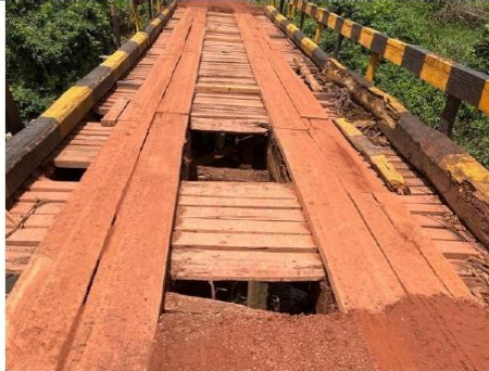
FOTO 19 - Construção de Ponte da Estrada do Km 74 Ponte 1