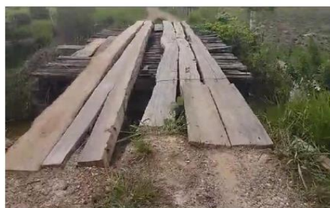
FOTO 14 – Reforma da Ponte da Estrada do Estrada do Cupim de Ferro Ponte 2