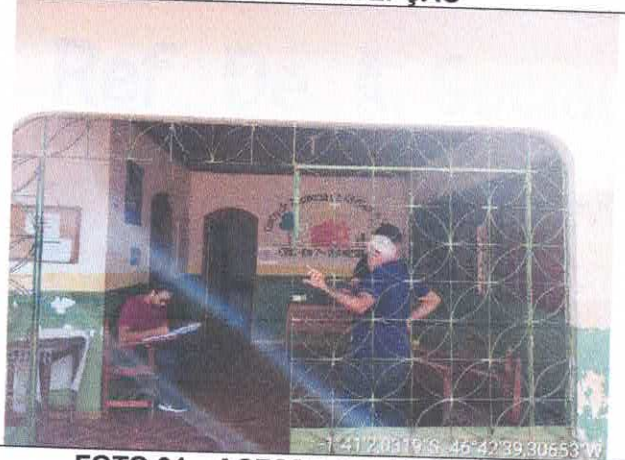
FOTO 02 - RECEPÇÃO