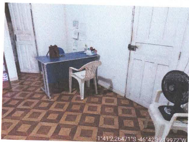
FOTO 05 - SALA 01