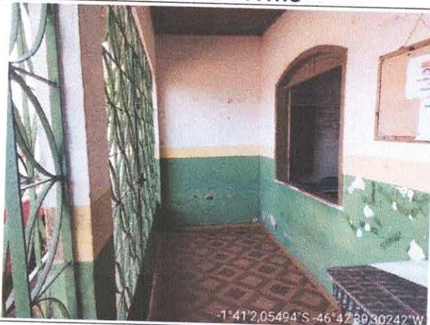
FOTO 03 - PÁTIO