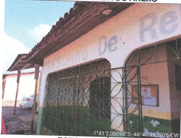
FOTO 01 - FACHADA DO ANEXO