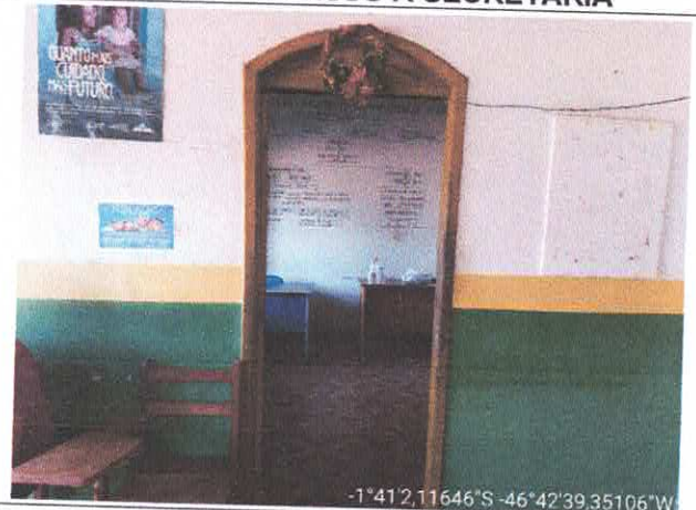
FOTO 04 - ACESSO A SECRETÁRIA