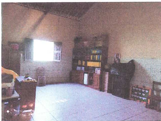
FOTO 03 - SALAS