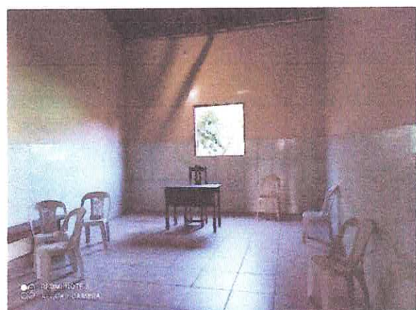
FOTO 05 - SALAS