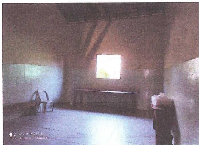
FOTO 06 - SALAS