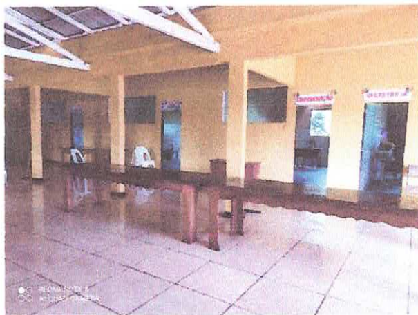
FOTO 02 - SALAS