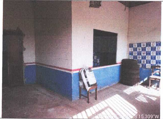
FOTO 02 - PÁTIO